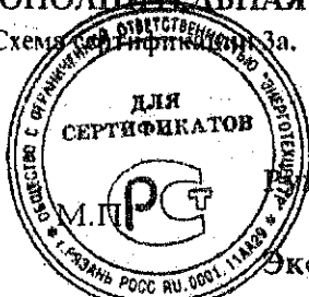
Схема Сер. Ответствен. За.